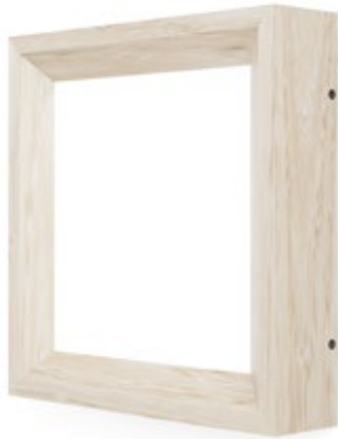
CHÊNE NATUREL / CNA