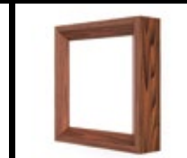
FRÊNE ACAJOU / FAC