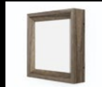
FRÊNE BRUN / FBR