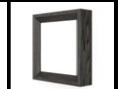
FRÊNE WENGÉ / FWE