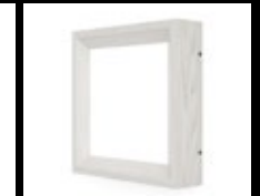
FRÊNE BLANC / FBL