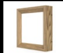
FRÊNE TECK / FTE