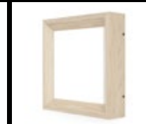
FRÊNE NATUREL / FNA