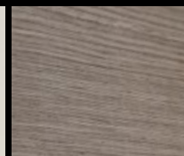
CP RE-EMPLOI GRIS