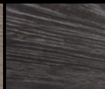
CP RE-EMPLOI ANTHRACITE