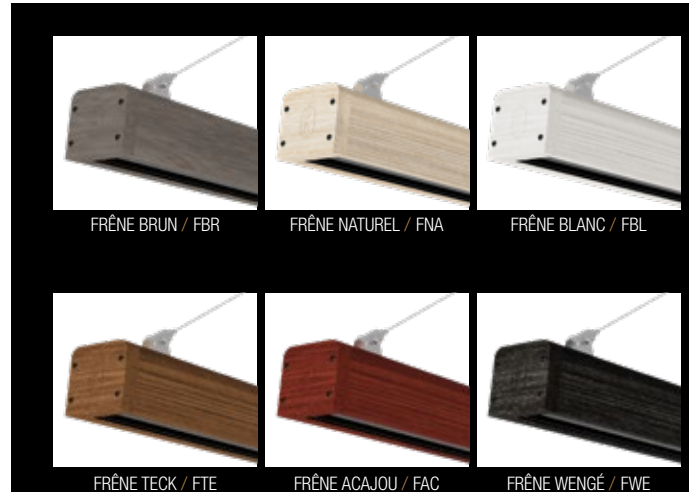
FRÊNE BRUN / FBR