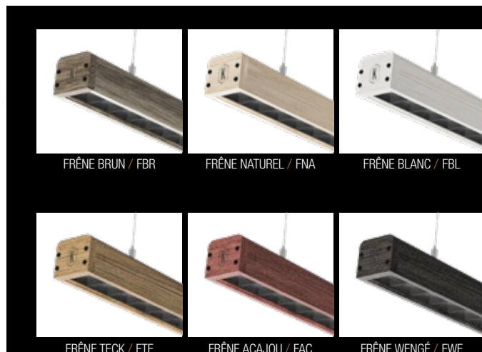
FRÊNE BRUN / FBR