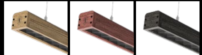
FRÊNE TECK / FTE