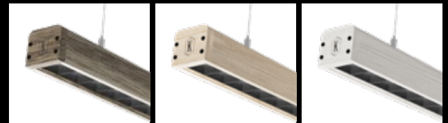
FRÊNE BRUN / FBR