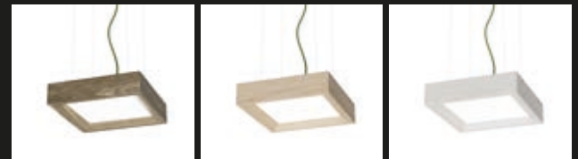
FRÊNE BRUN / FBR