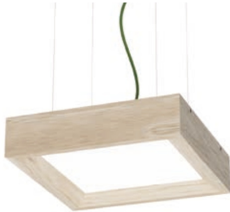
CHÊNE NATUREL / CNA