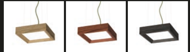
FRÊNE TECK / FTE