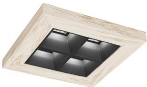
CHÊNE NATUREL / CNA

□ | IP20 | 850° | IK08 | FAISC. 50°~ 80°* | UGR&lt;16* | CUT. 95X95MM | DRI. DEP | NO DIM