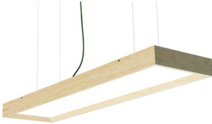
CHÊNE NATUREL / CNA

□ | IP20 | 650° | FAISC. 120° | UGR19 | DRI. INC